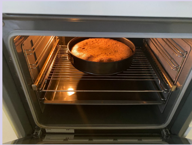
9h15 : photo 6