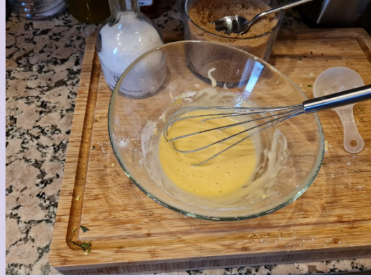
8h45 : photo 4