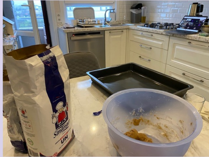
9h00 : photo 5