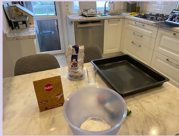
8h30 : photo 3