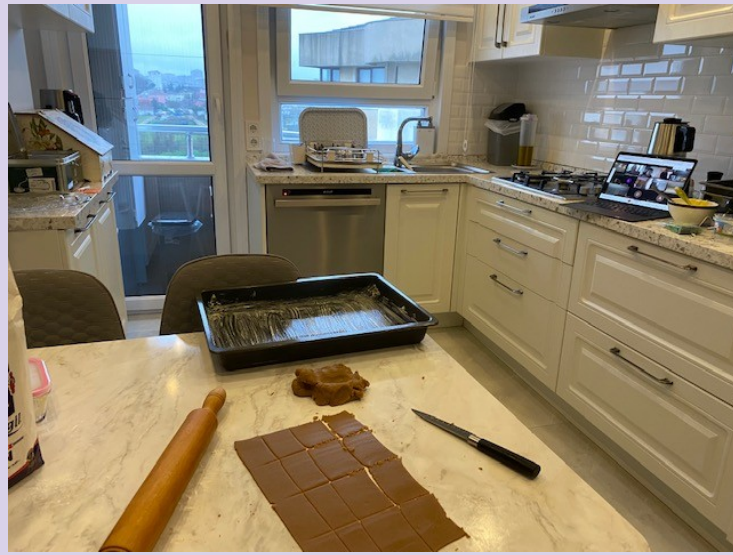
9h30 : photo 7