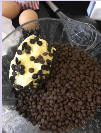
8h30 : photo 3