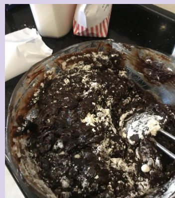
9h00 : photo 5