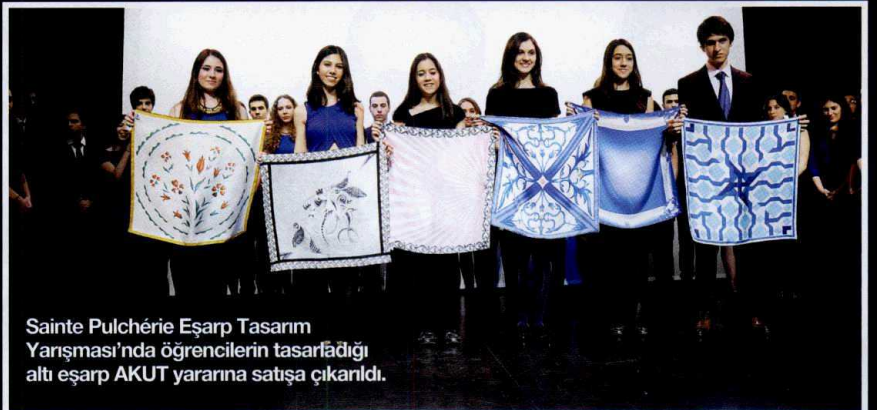
Sainte Pulchérie Eşarp Tasarım Yarışması'nda öğrencilerin tasarladığı altı eşarp AKUT yararına satışa çıkarıldı.

cu açıklanırken, geceye iş dünyası, cemiyet hayatının önemli isimleri ile veliler, öğrencilerin heyecanına tanık oldular.